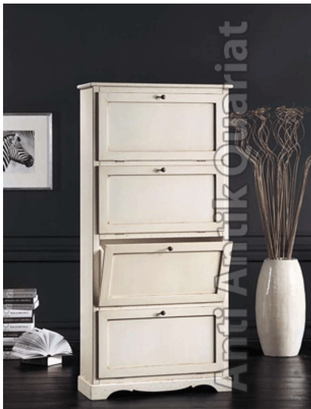
CV1-054-281 omarica za čevlje, 4p, 79x30x170