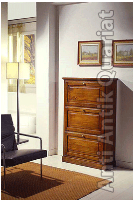
ZAN5-004-1219/A omarica za čevlje, 3v, 80x30x130