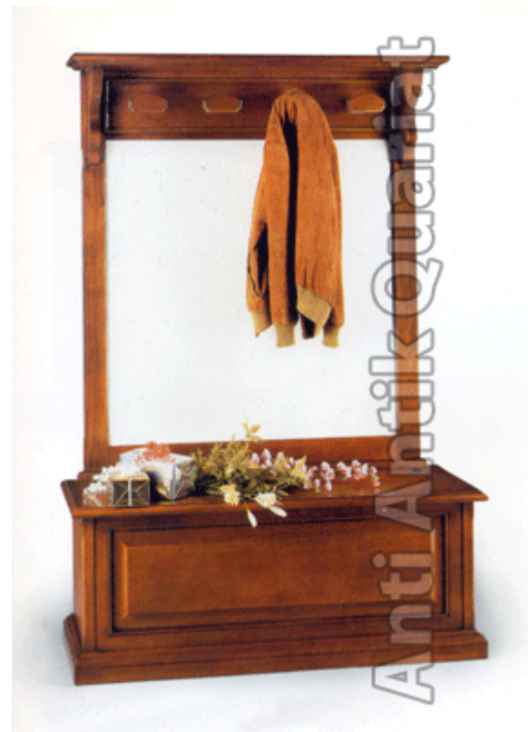
ZAN6-005-210/A skrinja, 127x39x51