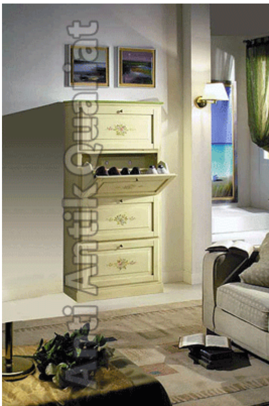
ZAN5-005-1221/A omarica za čevlje, 4v, 80x30x170