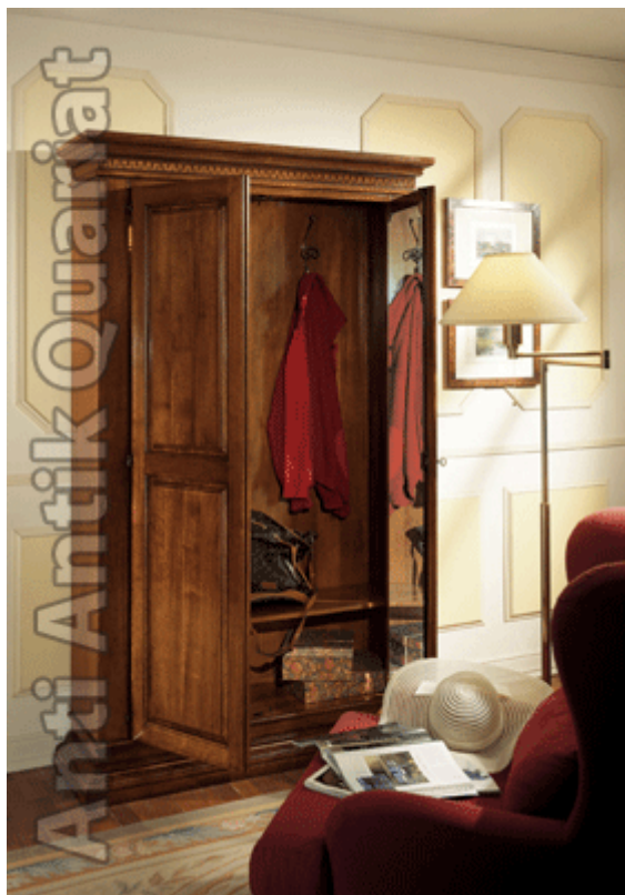
ZR1-047-814 omara za predsobo, 2v, 127x41x209