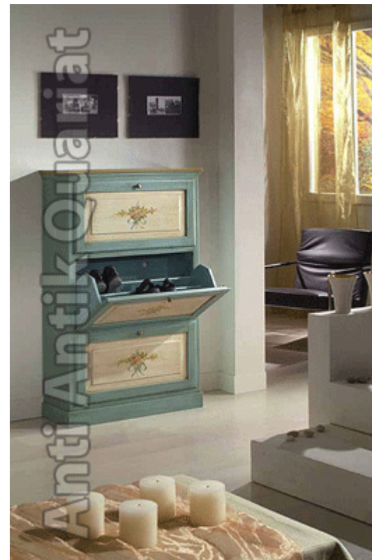
ZAN5-004-1218/A omarica za čevlje, 3v, 80x30x130

Stone d.o.o., Razstavni salon, Zaloška 54, 1000 Ljubljana Telefon: 01 54 27 260 Fax: 01 54 27 264 E-mail: salon@stone.si http://www.stone.si