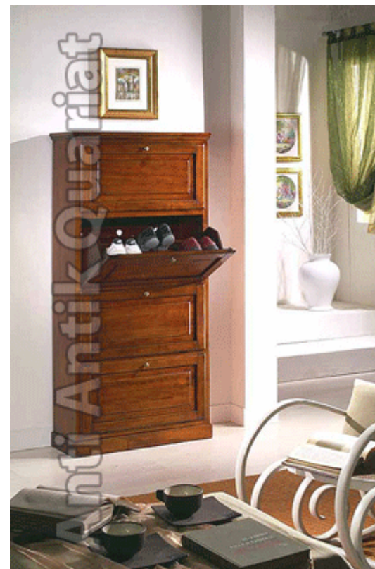
ZAN5-005-1220/A omarica za čevlje, 4v, 80x30x170

Stone d.o.o., Razstavn salon, Zaloška 54, 1000 Ljubljana Telefon: 01 54 27 260 Fax: 01 54 27 264 E-mail: salon@stone.si http://www.stone.si