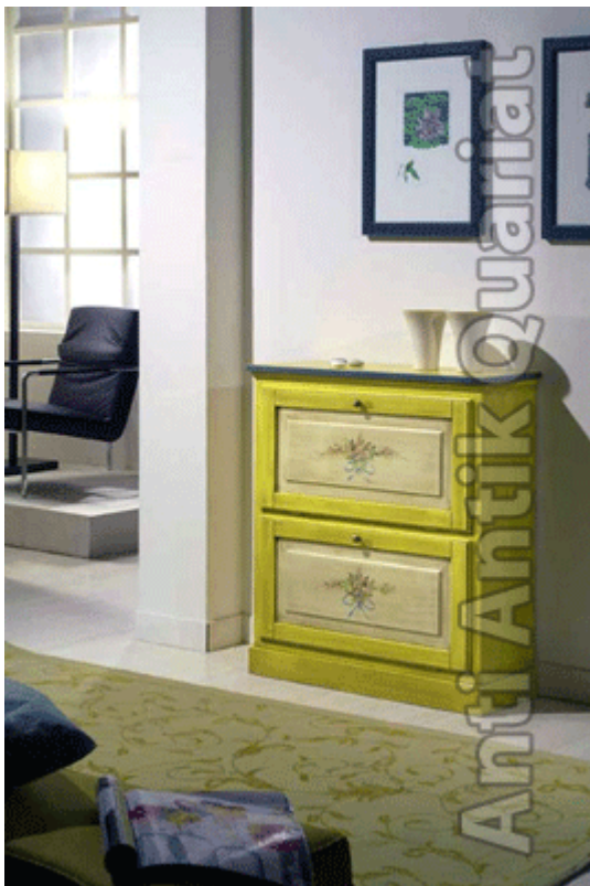
ZAN5-003-1217/A omarica za čevlje, 2v, 80x30x93