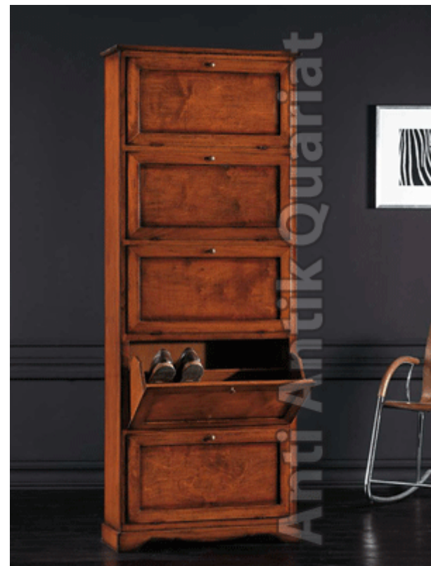
CV1-055-282 omarica za čevlje, 5p, 79x30x210

Stone d.o.o., Razstavni salon, Zaloška 54, 1000 Ljubljana Telefon: 01 54 27 260 Fax: 01 54 27 264 E-mail: salon@stone.si http://www.stone.si