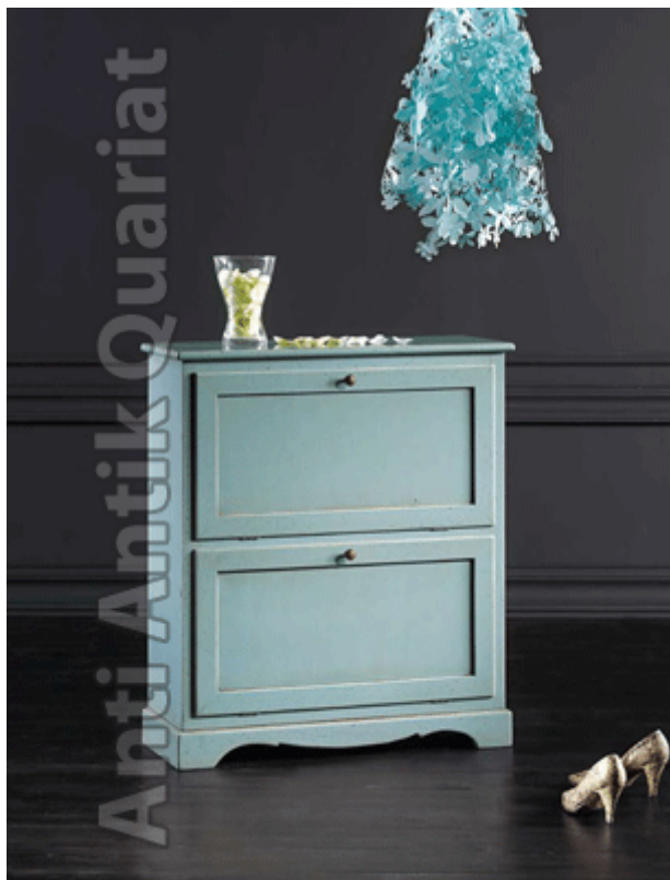
CV1-052-279 omarica za čevlje, 2p, 79x30x90