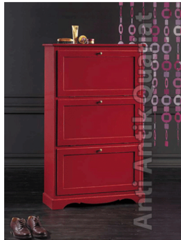
CV1-053-280 omarica za čevlje, 3p, 79x30x130

Stone d.o.o., Razstavni salon, Zaloška 54, 1000 Ljubljana Telefon: 01 54 27 260 Fax: 01 54 27 264 E-mail: salon@stone.si http://www.stone.si